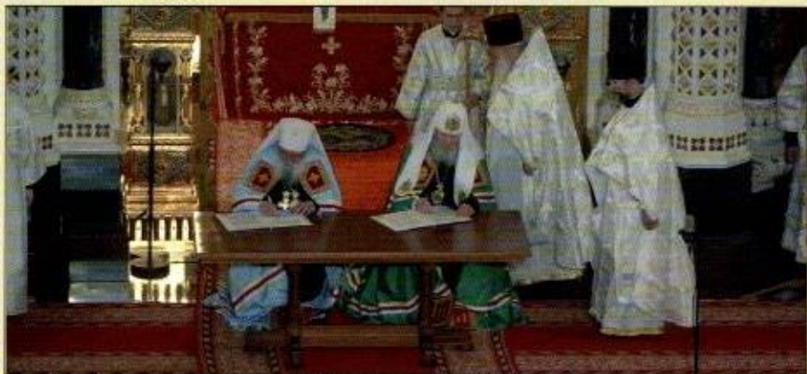
Podpis dokumentu o kanonickej jednote medzi Ruskou pravoslavnou cirkvou Moskovského patriarchátu a Ruskou pravoslavnou cirkvou v zahraničí. Patriarcha Alexij II. a arcibiskup Lavr.