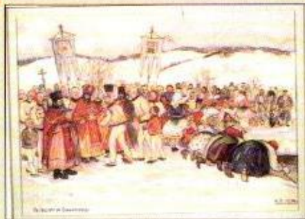
„Na Jordani“ v Ladomirovej

svätyne: čiastočka z hlavy sv. Jána Krstiteľa, ostatky svätých Dionýzia Aeropagitu, mučeníka Charalampia, veľkomučeníka Pantelejmona, apoštola Andreja Prvozvaného, Gregora Bohoslova a jeho brata prepodobného Kesiaria, Atanáza Veľkého, mučenicice Paraskevvy, mučeníkov Zografských a z Jeruzalema striebrom okovaný