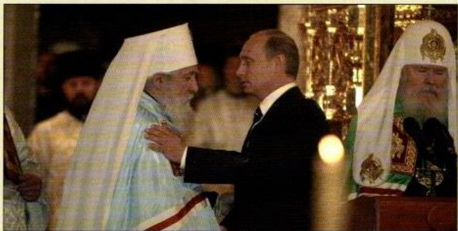
Arcibiskup Lavr s prezidentom Ruska V. Putinom, r. 2004