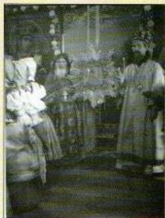
Počajevskaja ikona Božej mater v Ladomirovej

Tohto roku uplynulo 85 rokov od posviacky pravoslávneho chrámu v Ladomirovej. Je to obdobie veľkých zápasov, čas radosti a krušných chvíľ. Čas veľmi poučnej histórie. V Ladomirovej veriaci ľud ukázal, že si vie obhájiť svoju identitu, svoje duchovné dedičstvo, vieru svätých otcov a duchovnú silu žiť vo svätom pravoslavíi.